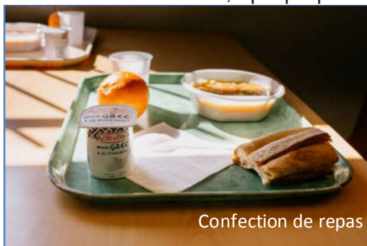
Confection de repas

Nous avons d'abord pris contact auprès des structures Emmaüs de la région parisienne qui effectuent des maraudes, qui préparent des