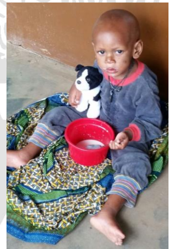
Un bébé malnutri consommant du F75 avec du lait écrémé pour diminuer ses œdèmes