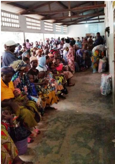
Notre salle d'attente pour les consultations

« L'amitié, c'est ce qui vient au cœur quand on fait ensemble des choses belles et difficiles. »