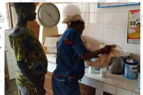
Ces mamans apprennent à préparer le lait infantile 1er âge