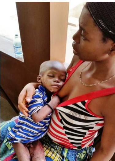
Un cas de malnutrition sévère