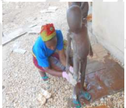
Chaque pensionnaire à son arrivée au Centre est traité de cette manière.

Placée sous la responsabilité juridique de l'Archevêque de Garoua, une équipe dirigeante de 5 membres est chargée du suivi psychoaffectif, médical, nutritionnel, éducatif, moral et spirituel des enfants.