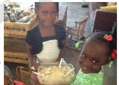
C'est l'heure du repas

« L'amitié, c'est ce qui vient au cœur quant on fait ensemble des choses belles et difficiles. »