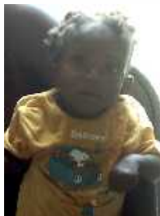
Exemple de malnutrition

A leur accueil ils sont souvent maigres et en état de malnutrition chronique, les cheveux jaunâtres, le ventre énorme et présentent des épisodes de diarrhée aigue.