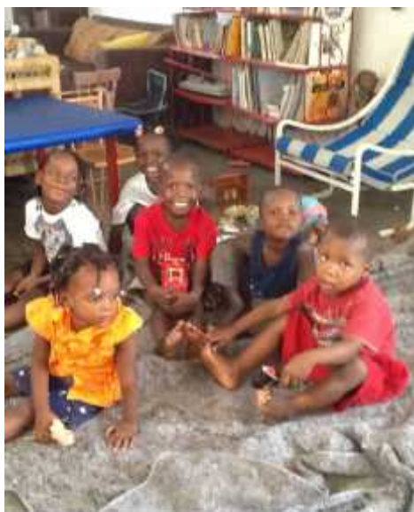
Quelques uns de nos enfants

Les besoins sont évidents, mais les contraintes sont là aussi, cependant nous sommes à HORIZON DE L'ESPOIR décidés plus que jamais à faire face et relever avec S.O.S. BOÎTES DE LAIT les énormes défis qui nous attendent.